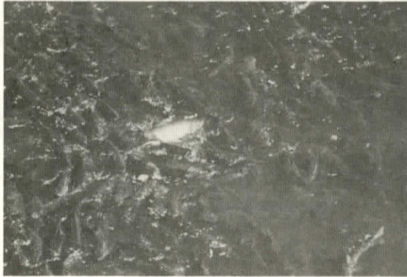
標津川にそ上した秋サケ

標津川に見るサケ、サーモン科学館内から人工魚道に見るサケが人を感動せしめるものと思えます。