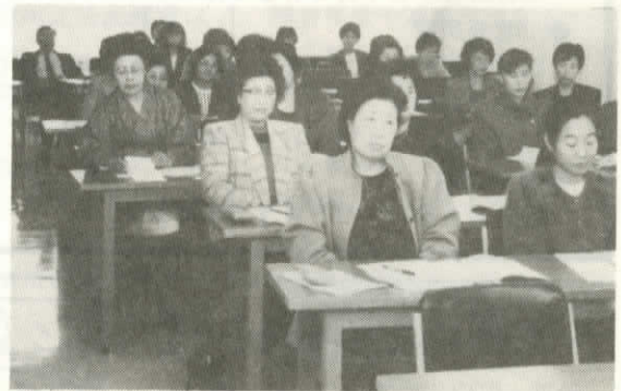
分散会で熱心に説明を聞く参加者