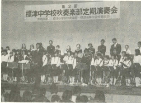
小・中・高一 体となった演奏会