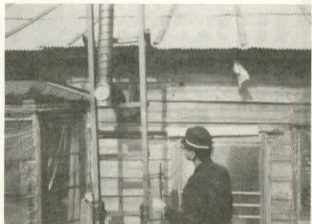
点検する消防職員

住まい安心 独居老人世帯 一人暮らしのお年寄りが、安心して生活できるようにと、十月二十六日から二日間、標津消防署と町役場職員が、町内七十カ所の独居老人世帯を訪ずれ、煙突やストーブ、ガスなど住宅の内外を確認し、火気の点検を行いました。