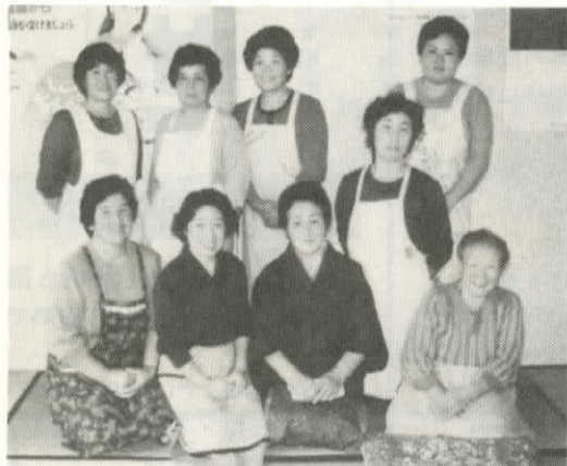
東浜町漁協婦人部の皆さん

かまぼこが出来あがれば応用編でお吸い物や、長ねぎのみじん切りをいれて酢味そあえ。また、わかめや長ねぎを入れて三杯酢などいろいろと応用ができます。試作してみてください。