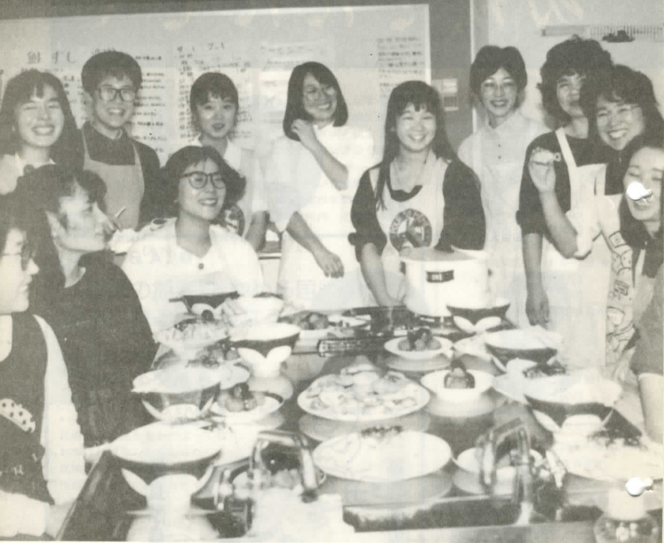
標津栄養士会による鮭の料理教室