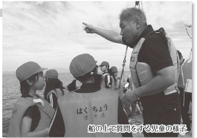
船の上で質問をする児童の様子

9月9日には、標津小学校5年生を対象とした漁業体験学習を行いました。標津漁協と標津さけ定置研究会のご協力をいただき、産地加工センターや市場、荷揚げ場、ホタテの種苗所を見学。また、調査船「はくちょう号」の乗船では、波しぶきではしゃいだり、漁協職員の方に質問をするなど、初めての体験に興味津々の様子でした。