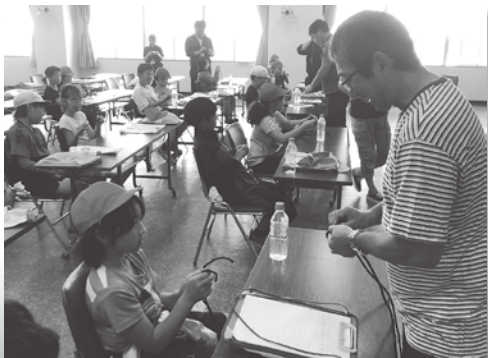
ロープワークを学ぶ児童の様子

最後は漁師さんに標津のサケ定置網漁や前浜で取れる魚の種類、ロープワークなどを教えていただきました。「海が怖いと思ったことは？」と児童からの質問には「怖いと感じるが、みんなに美味しい魚を届けるために漁を続けている」と答えに、改めて漁師さんへのありがたみを感じていました。