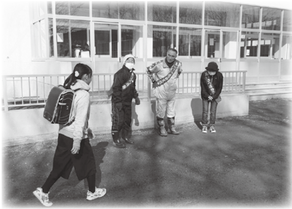
あいさつ運動の様子（昨年度の写真）

健全な青少年を育てる標津町民の会と標津高校、標津中学校、川北中学校の生徒会、町教育委員会が連携して、本年度も「春のあいさつ運動」を実施します。