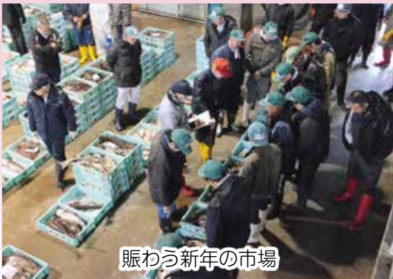
賑わう新年の市場

標津漁業協同組合の新春「初競り」が、1月6日、同組合の地方卸売市場で行われ、組合員や仲買人など関係者約50人が参加しました。