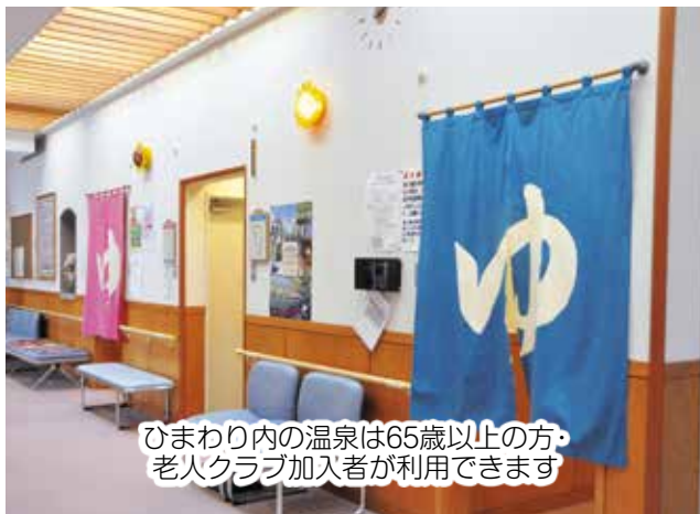
ひまわり内の温泉は65歳以上の方・老人クラブ加入者が利用できます

高齢者担当 では、高齢者の健康増進や保養促進、社会参加支援を担っています。花壇の整備などを行っているシルバー勤労会に関する業務も担当しています。