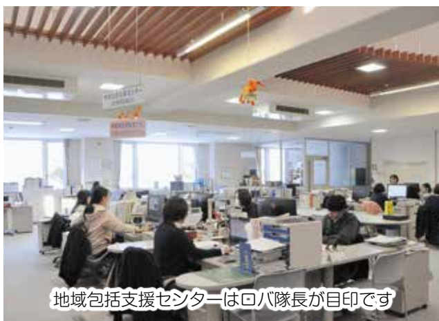
地域包括支援センターはロバ隊長が目印です

地域包括支援センター は介護・医療・保健・福祉などの側面から高齢者を支える、総合相談窓口です。専門知識を持った職員（保健師や社会福祉士）が、介護を中心とした生活上の困りごとの相談、高齢者の権利を守ること、介護予防の取り組みなどを行っています。