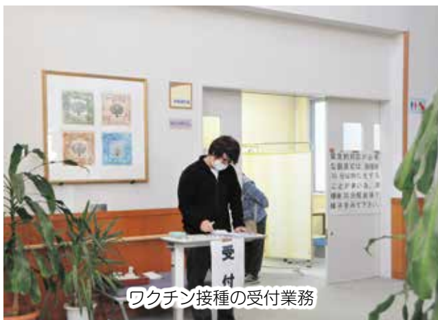
ワクチン接種の受付業務

生委員児童委員に関する事務などを行っています。本町のアイ又相談員はこちらに常駐しています。また、生活保護の相談もこちらで受け付けています。