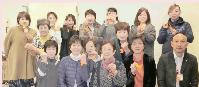
（標津町商工会女性部 令和2年1月19日開催）