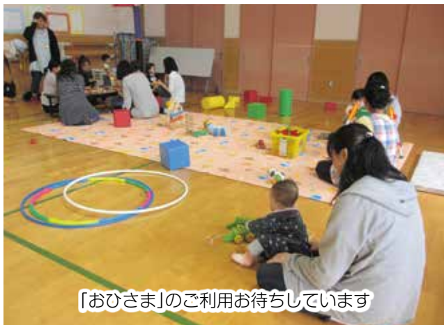
「おひさま」のご利用お待ちしております

子育ての悩みや、育ちの不安、遊び方など、誰でも気軽に相談できる場所ですので、一人で悩まずぜひご相談ください。