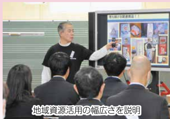
地域資源活用の幅広さを説明

町教育研究所主催の「魁 さまがけ 研修会」が、12月25日、標津小学校で行われ、町内の教員約50人が参加しました。