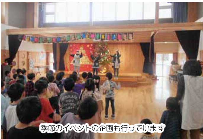
季節のイベントの企画も行っています

また、基本的な生活習慣を身に付けた子どもへの育成、ふるさと教育の充実、「幼児期の終わりまでに育ってほしい姿」を意識した指導・支援に努めているほか、こども園に入園していない子の一時保育も行っています。