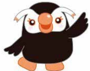
北方領土エリカちゃん

日時：1月31日(金)～2月14日(金) ※最終日は15時まで 場所：生涯学習センターあすばるロビー 主催：北方領土復帰期成同盟根室地方支部 共催：町、千島歯舞諸島居住者連盟標津支部