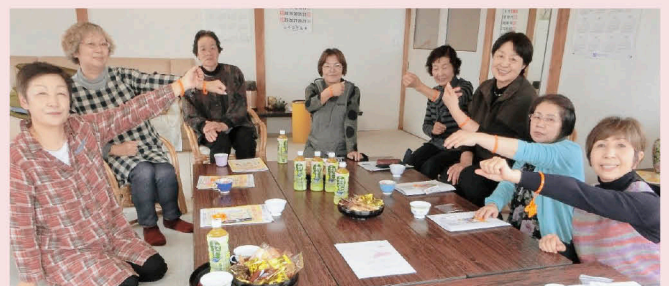
（住吉町女性部 令和元年11月12日開催）