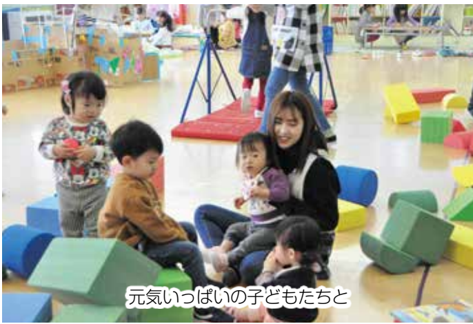
元気いっぱいの子どもたち

どの行事には積極的に参加し、餅つきなどの園行事では地域の方々の協力を得て実施するなど、地域の方々とのつながりを大切にしています。