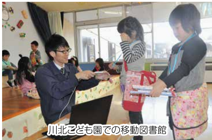
川北こども園での移動図書館

図書館の資料の選書、蔵書登録や貸し出し業務のほか、収蔵してほしい本のリクエスト受付や、川北地区の学校やこども園への移動図書館などをおして、読書や学習の支援を行っています。