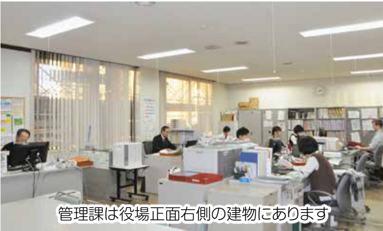
管理課は役場正面右側の建物にあります

教育委員会は、教育長を長として独立した組織として活動しています。このうち管理課は、学校教育と文化財保護に関わる業務を行う部署です。職員12人が4つの担当に分かれて勤務しているほか、各学校の公務補2人が所属しています。