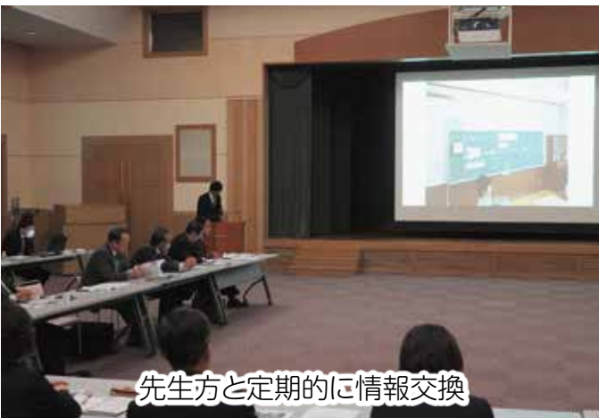
先生方と定期的に情報交換