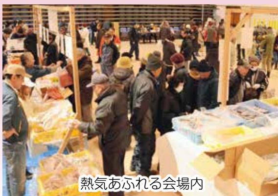
熱気あふれる会場内

第20回標津町加工品まつり（町水産加工振興協会主催）が、12月8日、文化ホールで行われました。