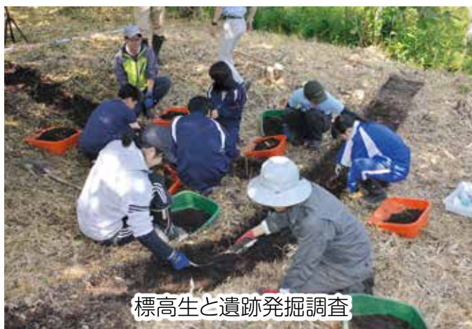
標高生と遺跡発掘調査

じめ、標津町内の文化財や自然、歴史、文化に関する総合的な保存活用をコーディネートしています。公園を訪れる観光客の案内業務や、所蔵資料を用いた企画展示の開催、地域のガイド団体や歴史愛好家団体、学校の授業支援などを行うほか、近年は日本遺産認定や、標津遺跡群の世界遺産登録に向けた取り組みも行っています。