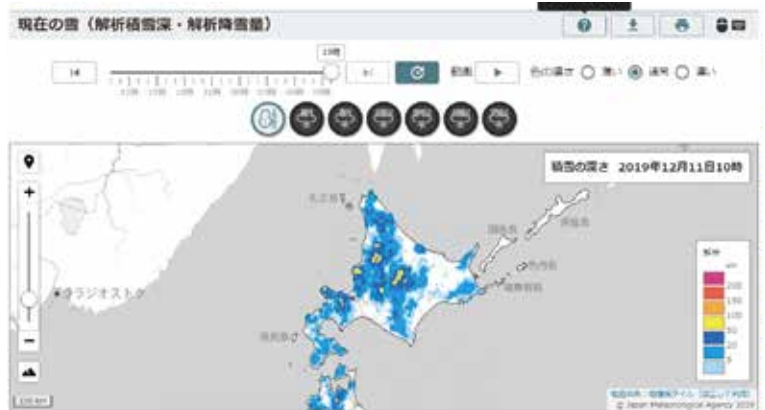
現在の雪(解析積雪深・解析降雪量)の画面の一例