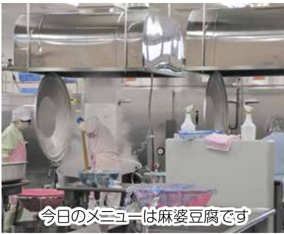
今日のメニューは麻婆豆腐です

給食担当と学校給食センター では、安心安全な学校給食の供給を通して、児童生徒の健全な育成を図っています。現在2園4校の給食を供給しており、来年度からは標津高校の給食もスタートします。