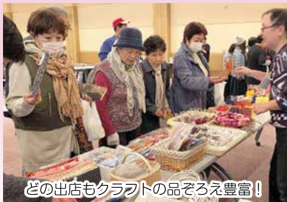
どの出店もクラフトの品ぞろえ豊富!

社会福祉協議会主催のふれあい広場が、11月30日、生涯学習センターあすばるで開催されました。この催しは町内の子どもから高齢者まで一堂に集う機会をと、平成25年から行われています。