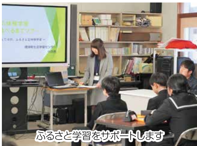
ふるさと学習をサポートします

1月には幼児から中学生まで参加できるサイエンスフェア、3月には大人も参加できるスノーシュー体験を予定していますので、ぜひご参加ください。