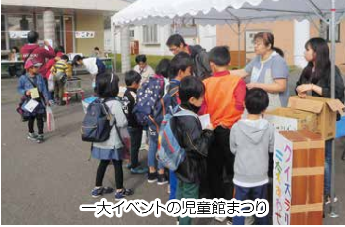
一大イベントの児童館まつり