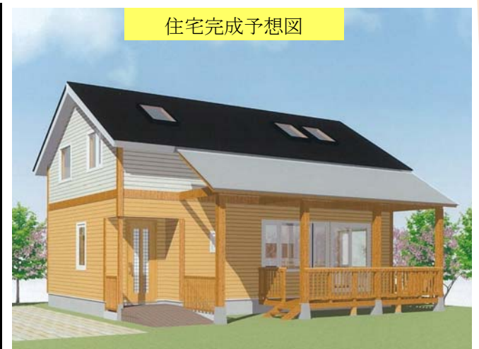
B-6区画 東京都 仲村邸(3人家族)

来場者の方には、両日ともに先着20名様に特典もご用意しておりますので、是非ご来場下さい。