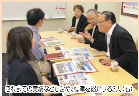
これまでの実績なども含め、標津を紹介する3人(右)

町と町観光協会、町旅館組合、町工コ・ツーリズム交流推進協議会の4者は、8月30日・31日の両日、東京都内の大手旅行代理店8社を回り、誘客のためのプロモーション活動「トップセールス」を展開しました。