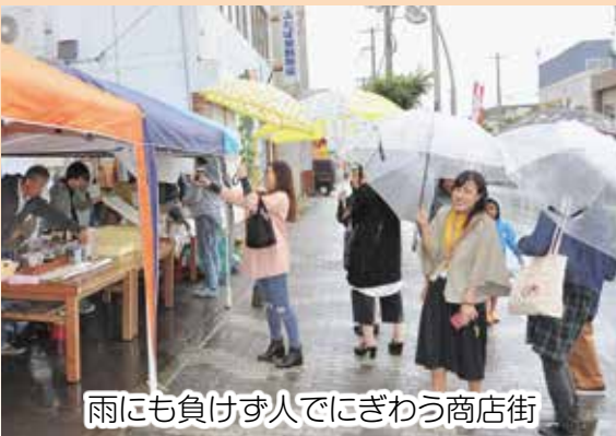
雨にも負けず人でにぎわう商店街

標津ぶらり朝市(同実行委員会主催)が、9月10日、国道244号沿いのホテル川畑から、しれとこ食堂にかけての二帯で開催されました。