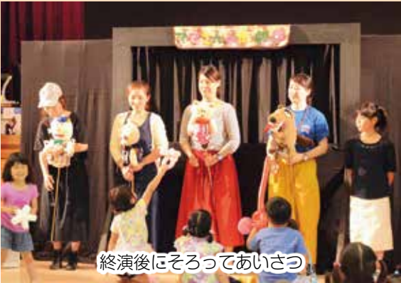
終演後にそろってあいさつ

子育て支援センターおひさまと子育てママたちによる「こにこおひさままつり2017」が、8月27日、文化ホールで開かれ、家族連れや地域住民など約400人が来場しにぎわいました。 子育て中の母親らが各得意分野を發揮し結集させた手づくりの催しで、今年で3回目。会場にはお手製の雑貨やお菓子、木のおもちゃなどのブースが並び、来場者はじっくり時間をかけて回りながら、世代を越えて交流。