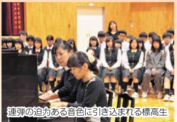
連弾の迫力ある音色に引き込まれる標高生

町教育委員会および北海道文化財団主催の出演授業「デュオ・トロイメライピアノ連弾コンサート」が、9月11日、標津高等学校校体育館で開かれ、全校生徒191人が、クラシック音楽について楽しく学びました。