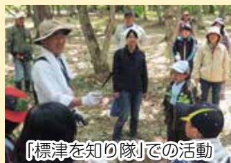
「標津を知り隊」での活動

た。本来であれば、自然だけでなく産業やそれを支える人々のこと、対象も子どもたちだけでなく大人の方まで広げて、「標津をふるさとに持つことのすごさ」を、それぞれが発見できる機会をつくれたら最高だったのですが、力不足だったのが少し心残りです。