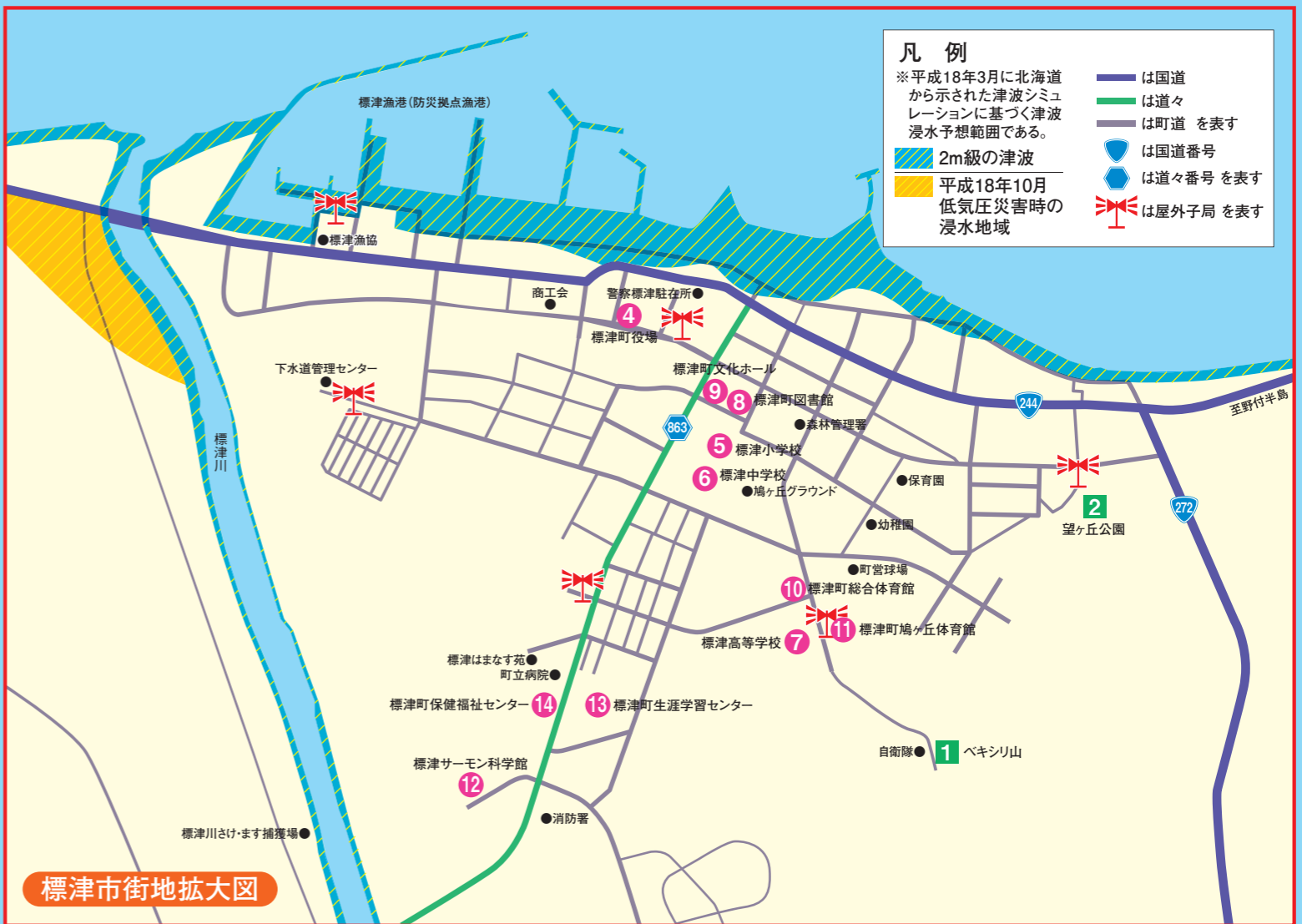
標津市街地拡大図